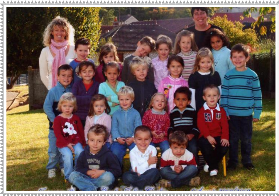
La classe de Maternelle