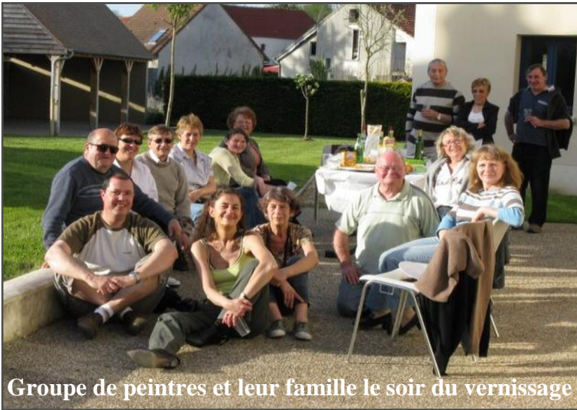
Groupe de peintres et leur famille le soir du vernissage