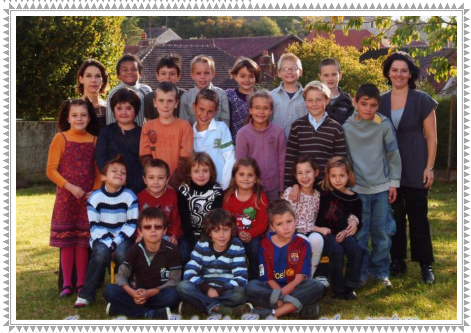
La classe de CM1 et CM2