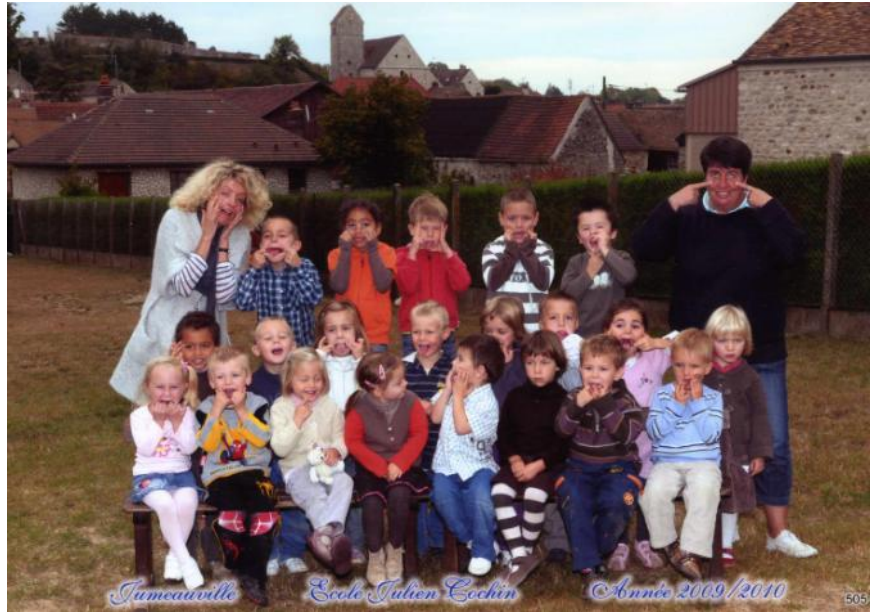
La classe de CP et CE2