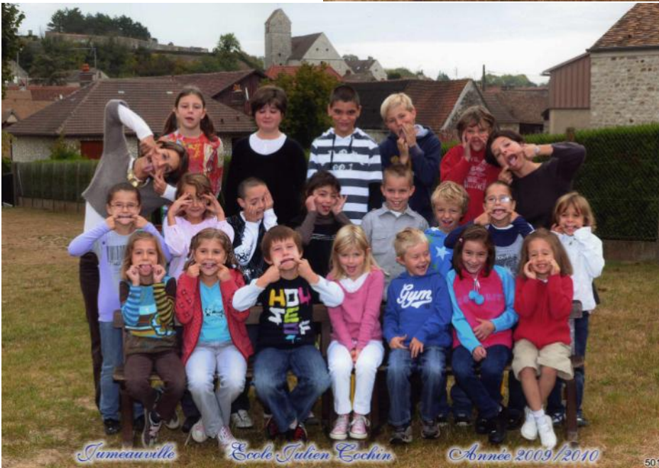
La classe de CM1 et CM2